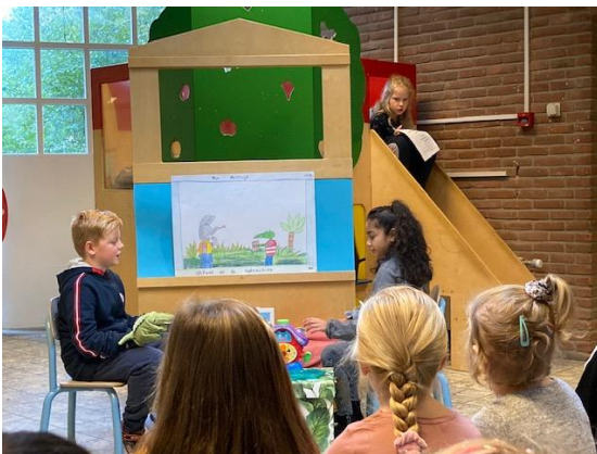
Groep 5 speelt poppenkast bij de kleuters