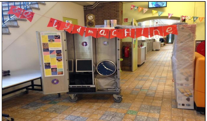
Opening van de Kinderboekenweek met een tijdmachine